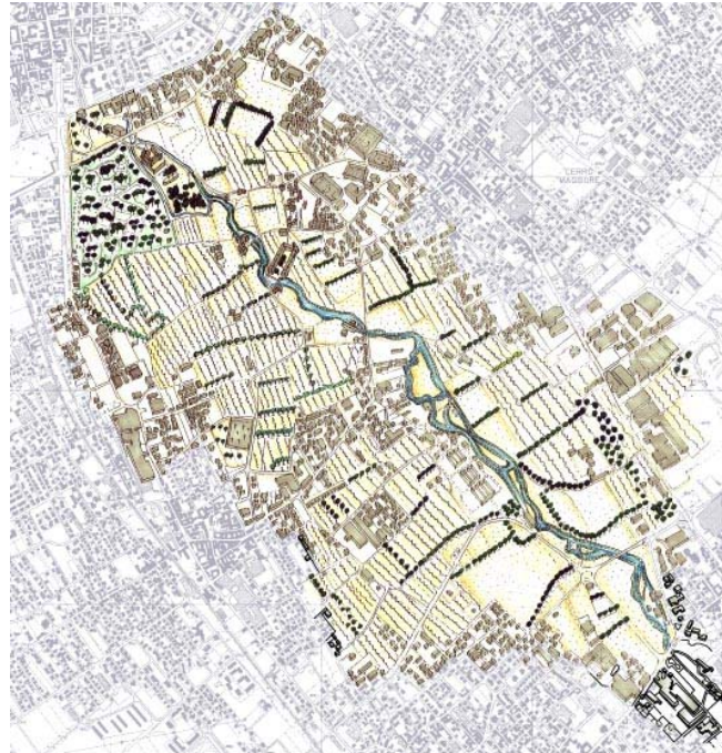
PROGETTI FUTURI INTERVISTATI: CITTADINI E AGRICOLTORI

PROBLEMS: a plan for building a local agricultural Park involving supramunicipal subjects is under way; possibly building lamination basins for curbing the Olona floods.